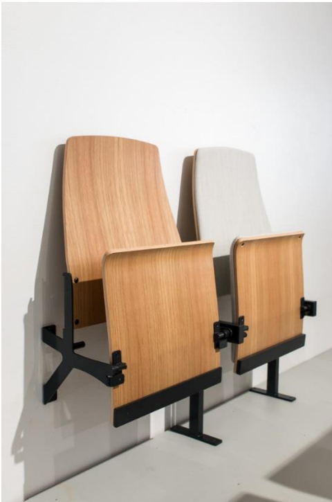
EduWall and Edu